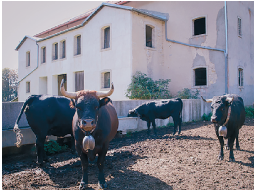
Les belles valaisannes ne combattent que si cela leur chante.

Si le combat est au centre de la fête, la périphérie n'a pas été négligée. «Il y aura un grand dîner sur inscription avec soupe à la courge, saucis-